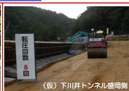
(仮)下川井トンネル盛岡側

大型ブロックと盛土で道路を拡幅しています。振動ローラで土を締め固めている状況です。