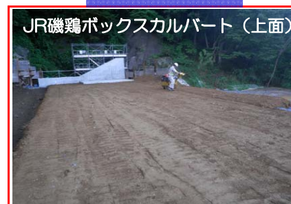
JR磯鶏ボックスカルバート（上面）