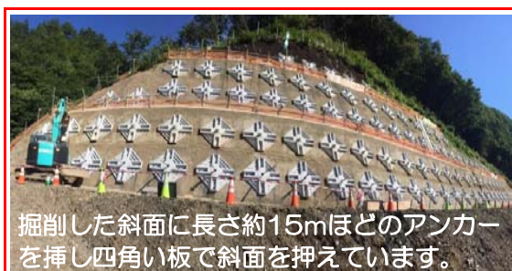
掘削した斜面に長さ約15mほどのアンカーを挿し四角い板で斜面を押えています。

斜面が崩れないように押える工事が完成しました。次は斜面を緑化するための草の種を蒔きます。