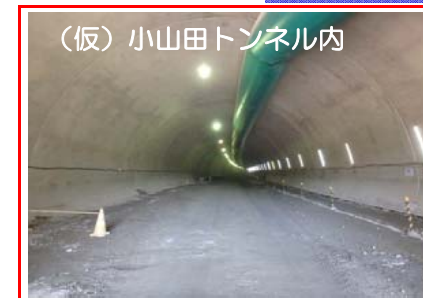
(仮)小山田トンネル内

トンネル工事は、盛岡側から進めており、全長1,100mのうち、掘削が約700mで進んでいます。また、宮古側のトンネル出口部においても掘削作業を進めています。