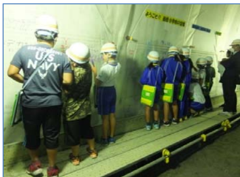
小山田トンネルの壁に全員でメッセージを書き込みました。

宮古市立藤原小学校の5年生9名による現場見学会が9月17日（木）行われました。現場見学は、防災学習の一環としての『命の道』について学習する事を目的としており、災害時に『命』を救う道路の役割、道路が作られていく過程を見学し、学びました。