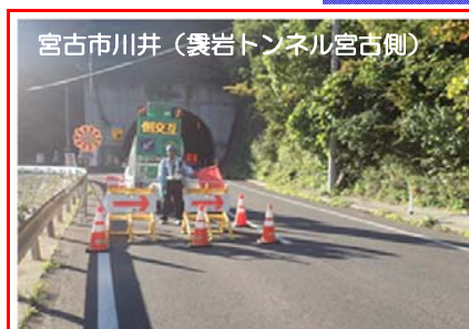
宮古市川井（巖トンネル宮古側）