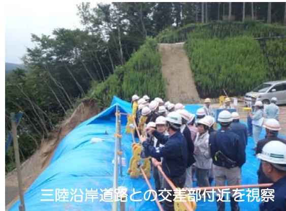
三陸沿岸道路との交差点付近を視察