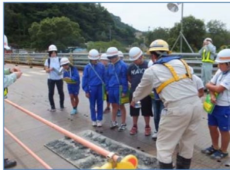
閉伊川に架かる橋の基礎部分の地質についての説明を受けました。