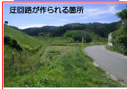
迂回路が作られる箇所