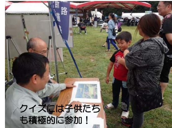
クイズには子供たちも積極的に参加！

やまびこフェスタ（道の駅：やまびこ館・平成27年9月13日（日））では、岩手河川国道事務所のPPPと共同でパネル展示し、来場した地域の皆様方に、宮古盛岡横断道路の整備効果および工事の進捗状況について説明し、宮古盛岡横断道路のクイズなどで多くの方々に参加して頂きました。来場された方々で最も多かった質問は、「全線開通はいつ頃ですか。」ということで、早期完成への大きな期待が感じられました。