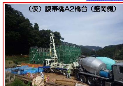
(仮)腹帯橋A2橋台（盛岡側）