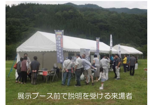
展示ブース前で説明を受ける来場者