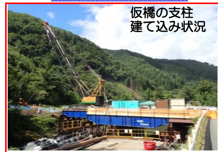
仮橋の支柱 建て込み状況