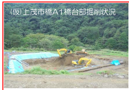
(仮)上茂市橋A1橋台部掘削状況