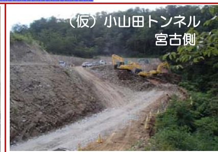
(仮)小山田トンネル 宮古側

トンネル工事は、盛岡側から進めており、全長1,100mのうち、掘削が約700mで進んでいます。また、宮古側のトンネル出口部においても掘削作業を進めています。