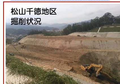
松山千徳地区 掘削状況