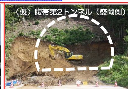
(仮)腹帯第2トンネル（盛岡側）