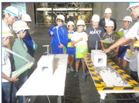
大きくて重いボックスカルバートをどのように設置するかを学習しました。